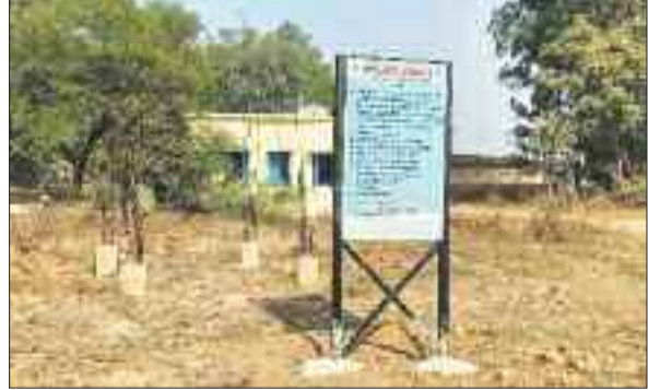
पानी टंकी के लिए बनाए गए कॉलम।

ग्रामीण क्षेत्र के लोगों को शुद्ध पेयजल उपलब्ध हो सके इसके लिए केन्द्र सरकार की महत्वपूर्ण योजना जल जीवन मिशन अंतर्गत पानी टंकी से लेकर पाइप लाइन विस्तार निर्माण कार्य कराना है। जिले के कई पंचायतों में निर्माण कार्य अंतिम चरण पर है तो कहीं अब भी निर्माणाधीन है। हैरानी की बात यह है कि ग्राम पंचायत पचिरा में जल जीवन मिशन योजना अंतर्गत पानी टंकी का निर्माण शुरू हुए एक साल हो गए। बावजूद इसके पानी टंकी के लिए महज चार फीट के चार कालम ही खड़ा हो सका है। ऐसे में गांव के लोग आज भी योजना का लाभ से वंचित है। ऐसा नहीं है कि संबंधित विभाग को इसकी जानकारी नहीं है परंतु किसी प्रकार के पहल नहीं करने से ग्रामीणों में आक्रोश व्याप्त है। केन्द्र सरकार की योजना के अनुसार विकासखंड सूरजपुर क्षेत्र के ग्राम पंचायतों में जल जीवन मिशन अंतर्गत पानी टंकी का निर्माण लगभग सभी पंचायतों साल भर पूर्व शुरू किए गए हैं। कई ग्राम पंचायत में पानी टंकी के अलावा घर घर तक नल कनेक्शन लगाए गए हैं तो कहीं