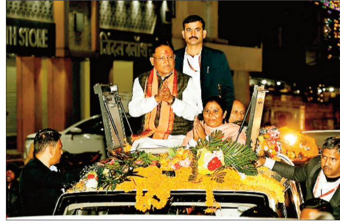
हरिभूमि न्यूज | जशपुरनगर