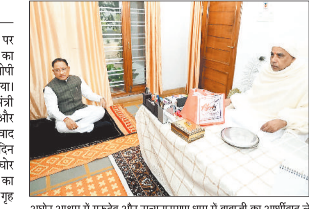
अंधोर आश्रम में गुरुदेव और सत्यनारायण धाम में बाबाजी का आशीर्वाद लेते सीएम विष्णुदेव।