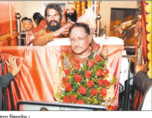
अंधोर आश्रम में गुरुदेव और सत्यनारायण धाम में बाबाजी का आशीर्वाद लेते सीएम विष्णुदेव।