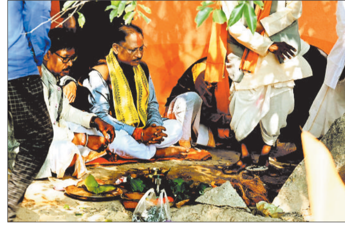
हरिभूमि न्यूज | जशपुरनगर