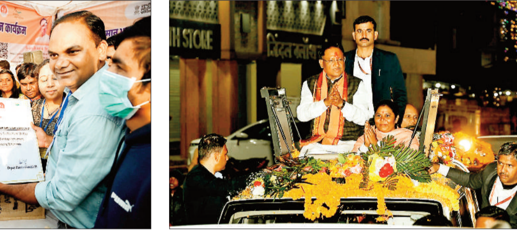
हरिभूमि न्यूज | जशपुरनगर