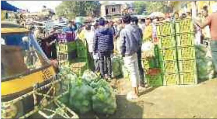
मण्डी में बोली लगाते व्यवसायी।

सरगुजा में सब्जी उत्पादन के रकबे में लगातार वृद्धि हो रही है। गांव-गांव में किसान सब्जियों की खेती कर रहे हैं। कम रकबे में अच्छा उत्पादन मिलने एवं अधिक आय होने से अन्य किसान भी सब्जियों की खेती से जुड़ते जा रहे हैं। अत्यधिक उत्पादन होने के कारण मांग के अनुसार यहां की सब्जियां दूसरे राज्यों में भेजी जाती है तथा यह क्रम पूरे साल चलते रहता है। पड़ोसी राज्यों में सब्जियों की मांग बढ़ने पर उत्पादकों को अच्छी आय होती है तथा स्थानीय बाजार में सब्जियों की उपलब्धता कम होने के कारण कीमतें आसमान पर पहुंच जाती हैं। एक महीने पूर्व पड़ोसी राज्यों में टमाटर की मांग बढ़ने के कारण कीमतें आसमान पर पहुंच गई थी लेकिन बाहरी राज्यों में मांग खत्म होते ही एक